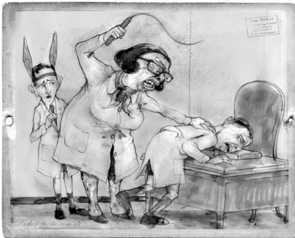
Foto: Sus alumnos la recuerdan como una docente apasionada.

11 Luego renuncia a la R.A.E. y se entrega por completo a la do- 12 cencia en colegios primarios.